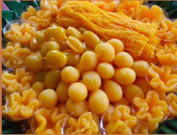
ขนมหวานที่ได้รับอิทธิพลจากโปรตุเกส