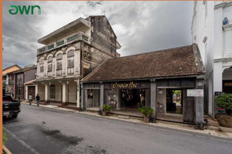
สถาปัตยกรรมชิโนโปรตุกีส ในอำเภอเมืองสงขลา