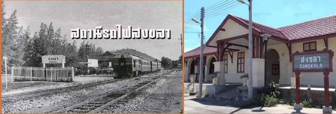
สถานีรถไฟสงขลา

รัชกาลที่ 5 นำระบบปกครองตะวันตกมาปรับใช้ → สร้าง รถไฟสายใต้ เชื่อมภาคกลางกับภาคใต้