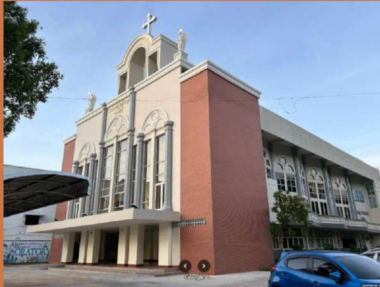
วัดแม่พระประจักษ์เมืองลอร์ด โบสถ์คริสต์ใน อ.หาดใหญ่ จ.สงขลา