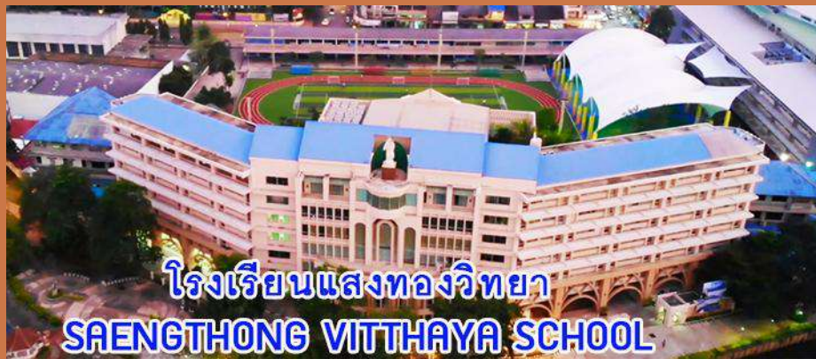
โรงเรียนแสงทองวิทยา อ.หาดใหญ่ จ.สงขลา (โรงเรียนคริสต์)