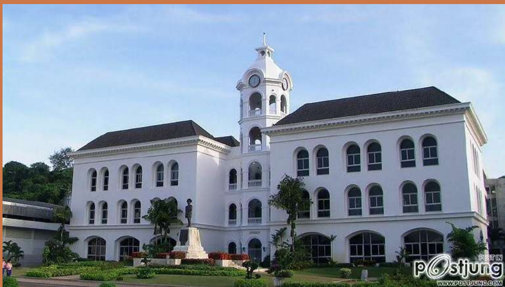
โรงเรียนมหาวิทยาลัยราชภัฏ จังหวัดสงขลา