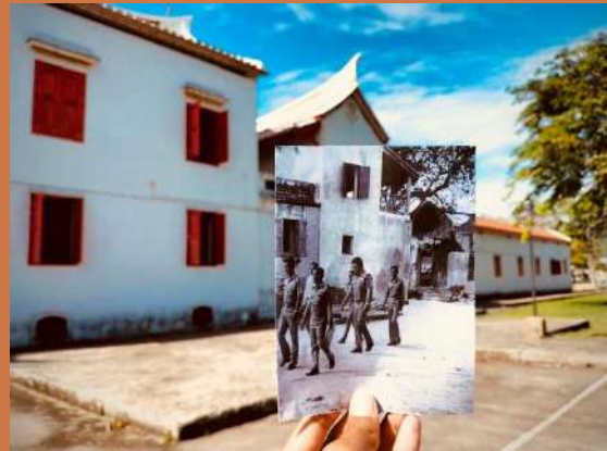
พิพิธภัณฑ์สถานแห่งชาติสงขลา (แต่เดิมเป็นศาลากลางจังหวัด)