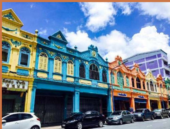
สถาปัตยกรรมชิโนโปรตุกีส ในอำเภอหาดใหญ่