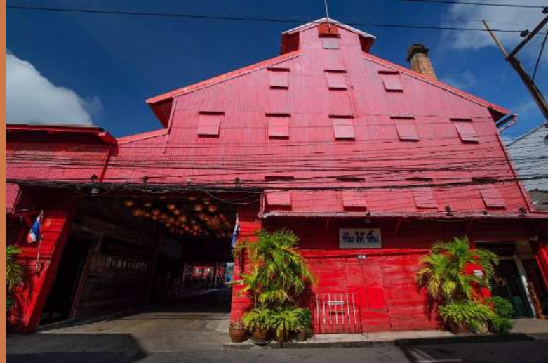
โรงสีข้าวหับให้หิน ออกแบบตามมาตรฐานอังกฤษ