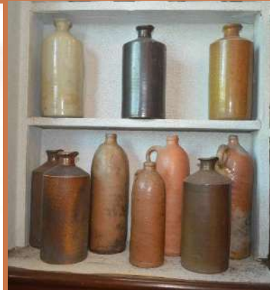
ขวดน้ำแร่จากเยอรมนี และขวดหมึกจากอังกฤษ