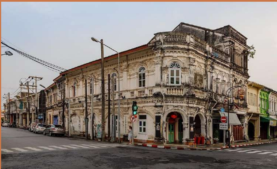
สถาปัตยกรรมชิโนโปรตุกีส ในภูเก็ต