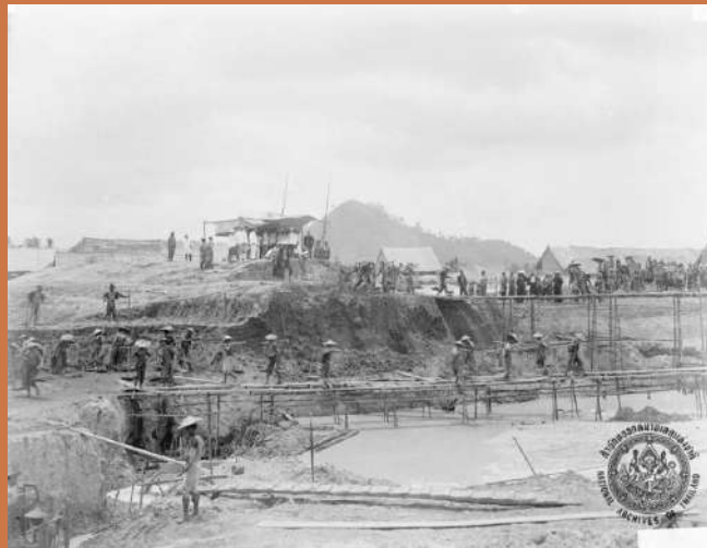
ภาพคนงานจีนมาจากปีนัง หาบแร่ ค.ศ.1909 (พ.ศ. 2452)