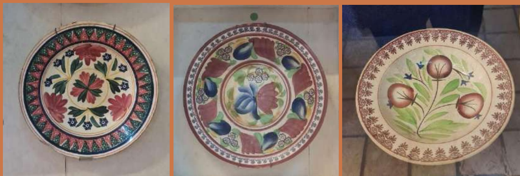
เครื่องถ้วยฮอลแลนด์