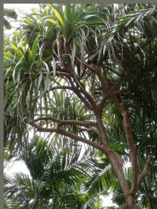
ต้นเตยปากนัน เป็นต้นไม้สกุลเตยทะเล pandanus มักขึ้นตามชายฝั่ง ภาษาไทยภาคกลาง เรียก ลำเจียก ภาษาไทยถิ่นใต้ เรียก เตยปากนัน ปากนัน