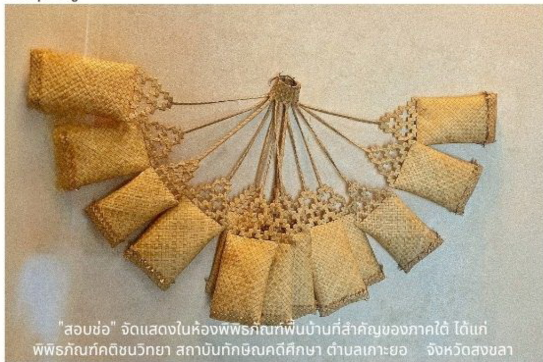
"สอบช่อ" จัดแสดงในห้องพิพิธภัณฑ์พื้นบ้านที่สำคัญของภาคใต้ ได้แก่ พิพิธภัณฑ์คติชนวิทยา สถาบันทักษิณคดีศึกษา ตำบลเกาะยอ จังหวัดสงขลา

รูปแบบที่ปรากฏนี้แสดงให้เห็นว่าภาชนะเหล่านี้ไม่ใช่เพียงวัตถุที่ใช้งานได้จริงเท่านั้น แต่ยังฝังลึกอยู่ในโครงสร้างทางสังคม เศรษฐกิจ และพิธีกรรมของวิถีชีวิตภาคใต้ รูปแบบ วัสดุ และการใช้งานของวัตถุเหล่านี้สะท้อนถึงค่านิยมทางวัฒนธรรมเฉพาะ อิทธิพลทางประวัติศาสตร์ และความเฉลียวฉลาดของคนในท้องถิ่นในการใช้ทรัพยากรธรรมชาติ การทำความเข้าใจในมิติที่กว้างขึ้นนี้ ช่วยยกระดับการวิเคราะห์ให้ลึกซึ้งยิ่งขึ้นกว่าเพียงแค่การระบุวัตถุที่อยู่